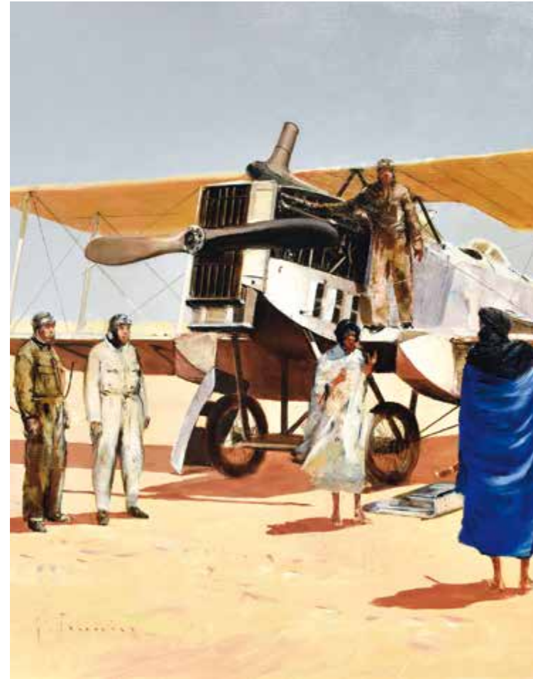
« Le drame du 11 novembre 1926 » du peintre et illustrateur J. Prunier, 2017 Musée de La Poste.